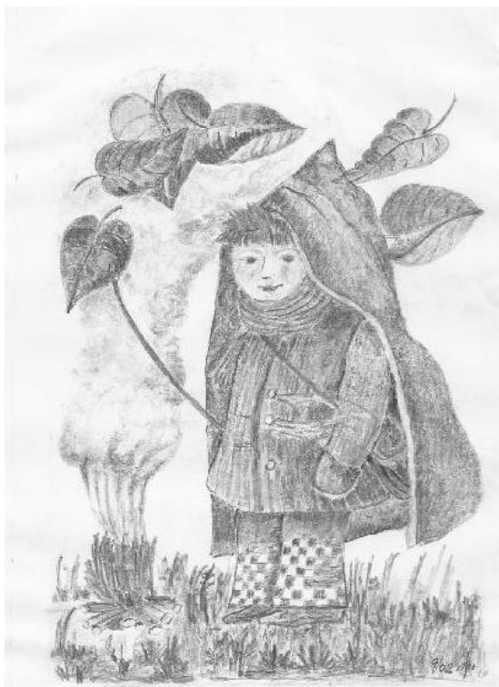
Ilustrace: J. Švajdová

Jen nestýskej si, vrátí se čas jara a s jarem míza do proutí. Do šedé mlhy padá země stará na malou chvílku usnouti.