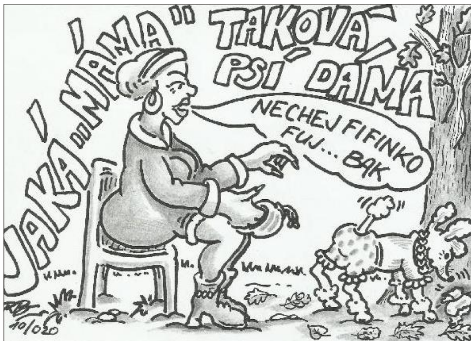
Ilustrace: Radim Bárta