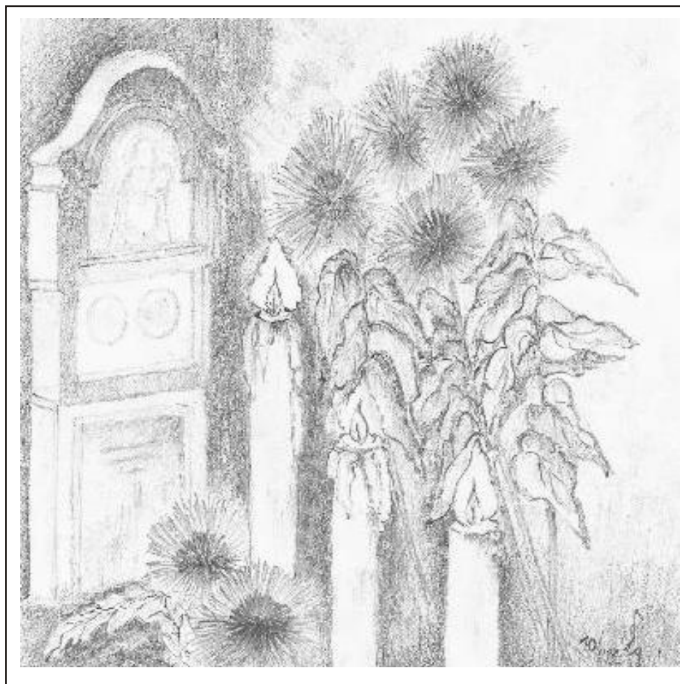
Ilustrace: J. Švajdová

Zpravodaj obcí Březnice - Bohuslavice - Salaš