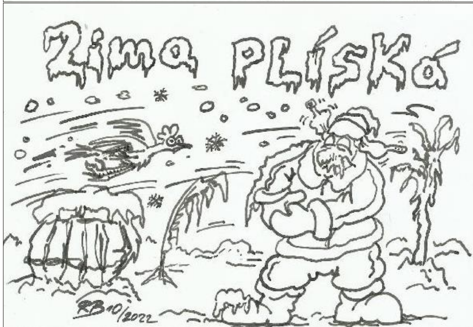
Ilustrace: Radim Bárta