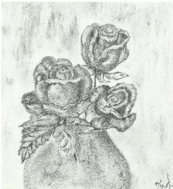
Ilustrace: J. Švajdová