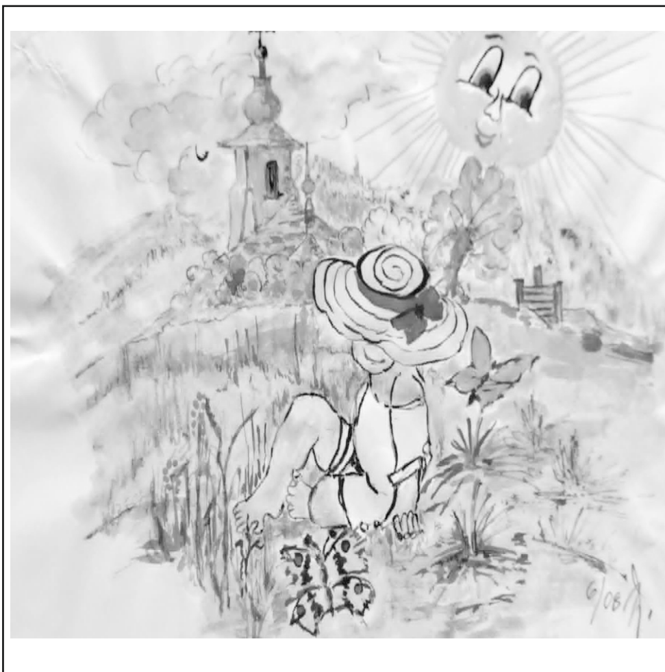
Ilustrace: Jindřiška Švajdová

Zpravodaj obcí Březnice - Bohuslavice - Salaš