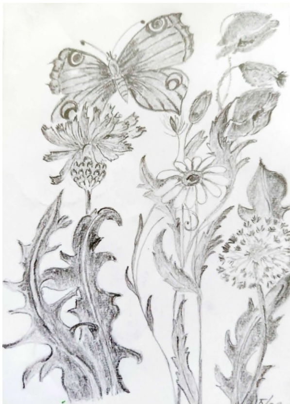
Ilustrace: J. Švajdová

Větrík skoro nedýchal a slunéčko hrálo, na záhonech v zahradě kvítí jak by spalo. Po obloze vlaštovky lítaly jak šípy, v úlu včely bzučely zpod košaté lípy. Ticho vše, jen pěnkava pípla někde v stromu, a zarostlý vodojem šplouchal tiše k tomu. Nad vodou se rákosí zvolna kolébalo, nad ním tančil mušek roj a šídlo jim hrálo. Napřed hlasně, potom tiš, tiše tak a spavě - ó jak se to usnulo v té vysoké trávě!