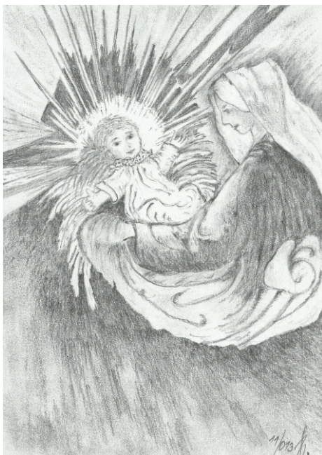
Ilustrace: J. Švajdová

Požehnání Jezulátka, skromné štěstí bez pozlátka. A tu čerstvou snítku jmelí, abychom se rádi měli.