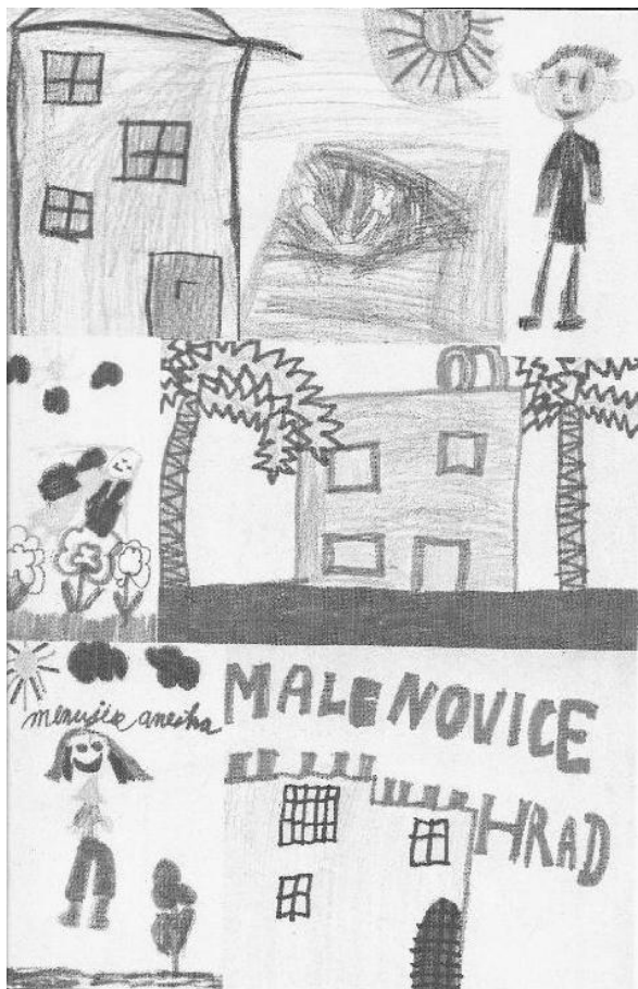
Nakreslily děti v náboženství 1. A 2. třída

NAŠE DĚDINY - zpravodaj obcí Bohuslavice, Březnice a Salaš. * Vydává Římskokatolická farnost Březnice, Březnice 14, 760 01 Zlín. * Své příspěvky můžete vložit do poštovní schránky farního úřadu v Březnici, poslat elektronickou poštou na adresu: nase.dediny@volny.cz nebo předat členům redakční rady. * Redakce si vyhrazuje právo na úpravu a krácení rukopisů, při výběru dává přednost textům stručným. * Nevyžádané příspěvky se nevracejí.