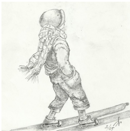
Ilustrace J. Švajdová