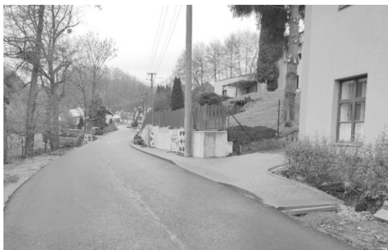
Projekt CHODNÍK V ÚSEKU KŘÍŽOVATKA FILIP - TOČNA | ETAPA 2