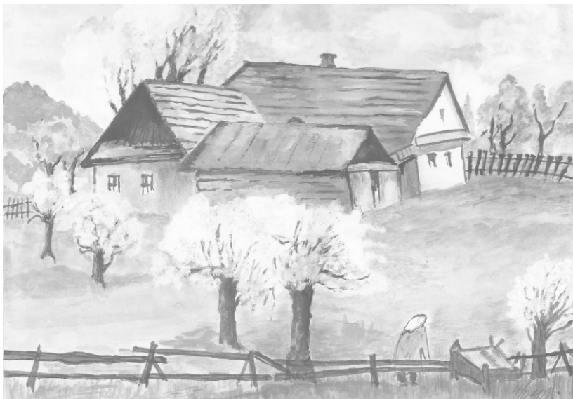
Ilustrace: J. Švajdová