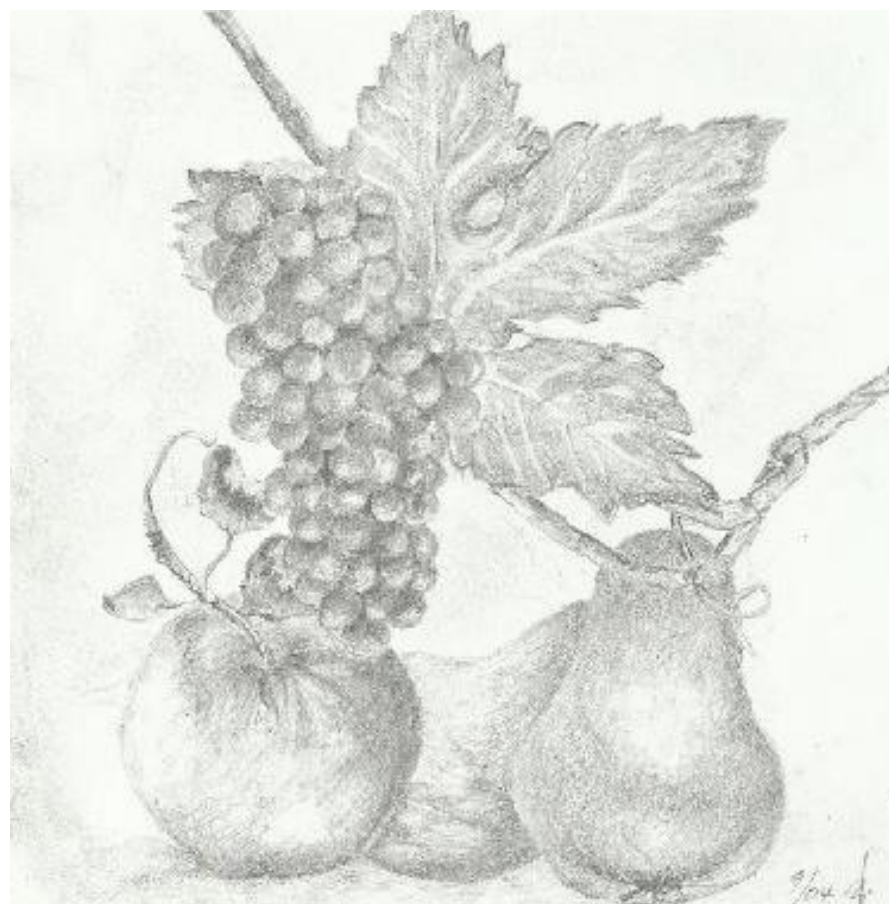
Ilustrace: J. Švajdová

Zpravodaj obcí Březnice - Bohuslavice - Salaš