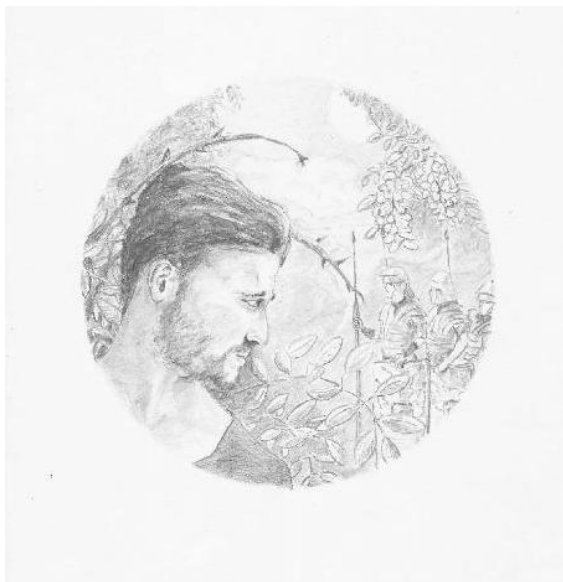
Ilustrace: P.V. Fojtík