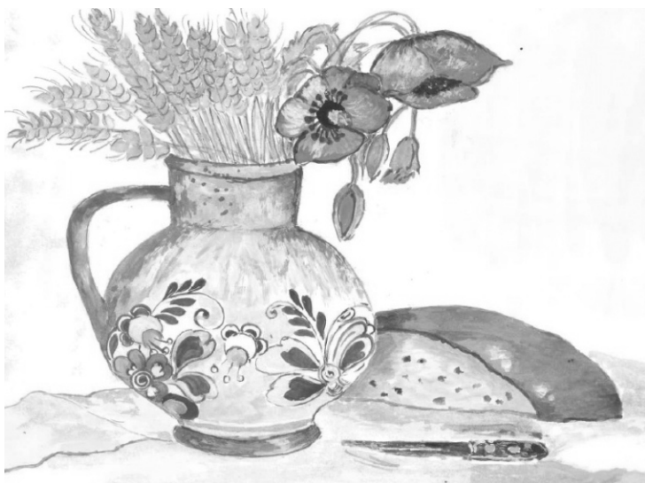
Ilustrace: J. Švajdová