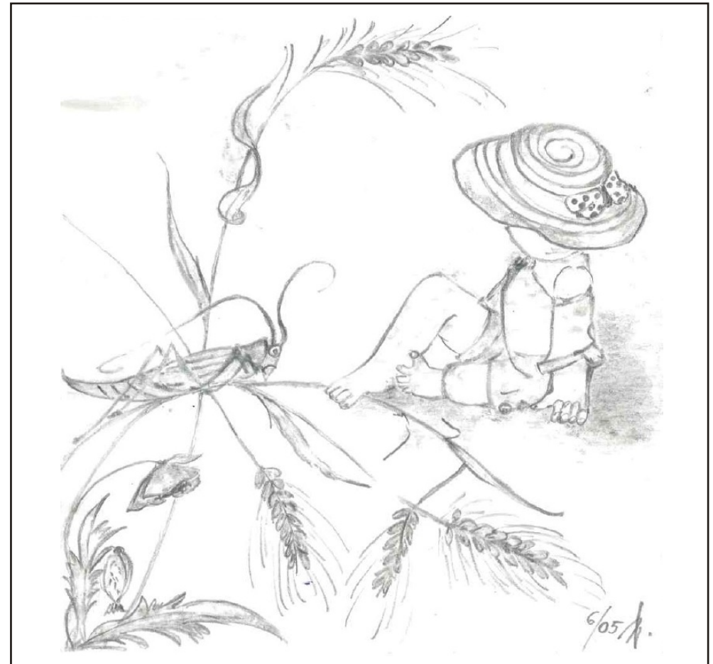
Ilustrace: J. Švajdová

Zpravodaj obcí Březnice - Bohuslavice - Salaš