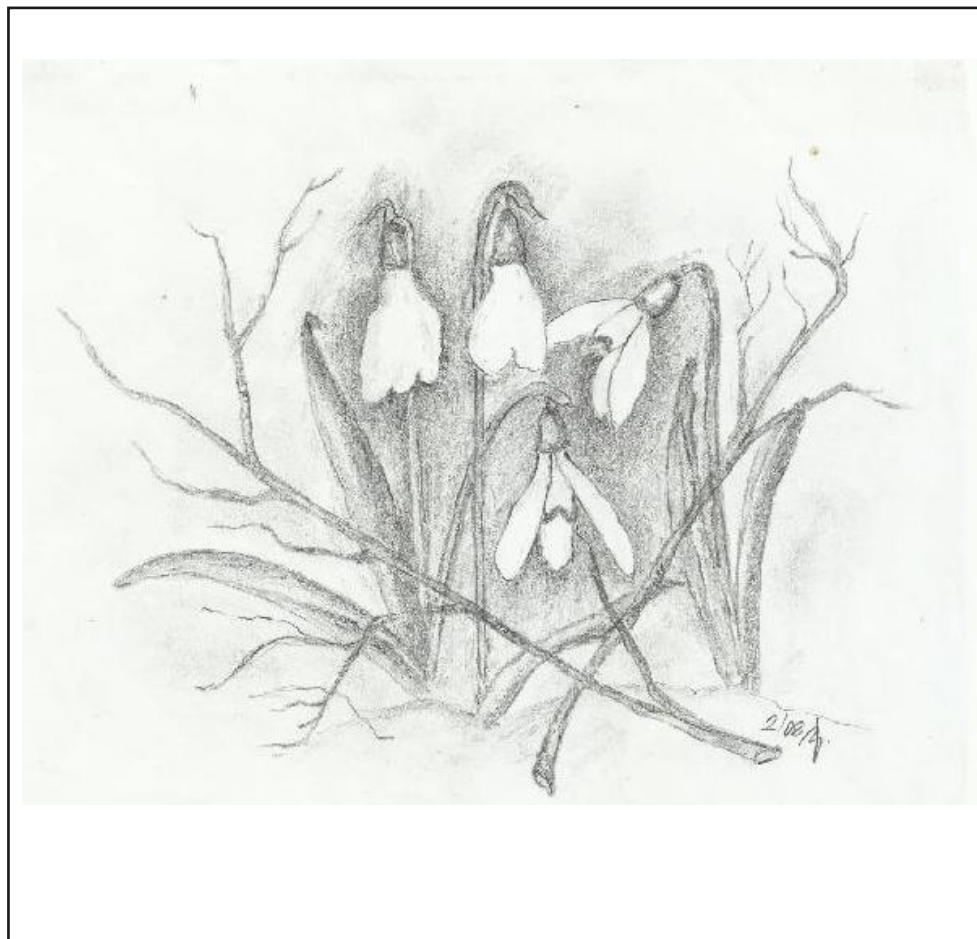
Ilustrace: J. Švajdová

Zpravodaj obcí Březnice - Bohuslavice - Salaš