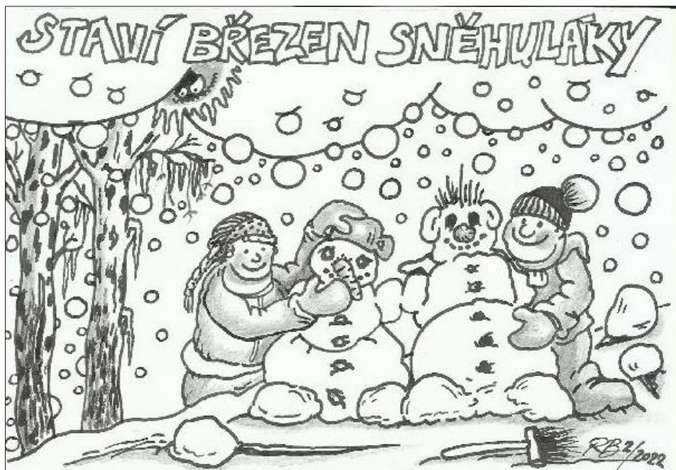
Ilustrace: Radim Bárta