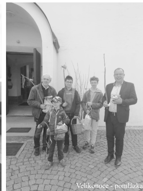
Velikonoce - pomlázka