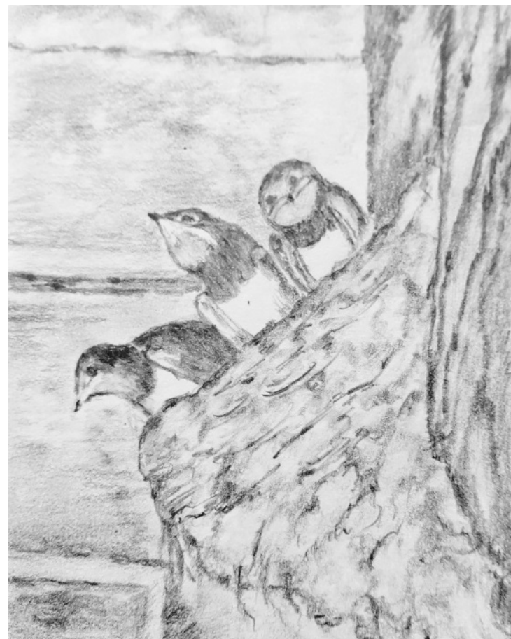
Ilustrace: J. Švajdová

Zpravodaj obcí Březnice - Bohuslavice - Salaš