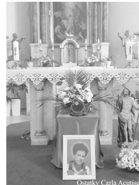
Ostatky Carla Acutise