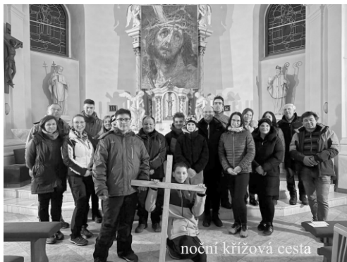
noční křížová cesta