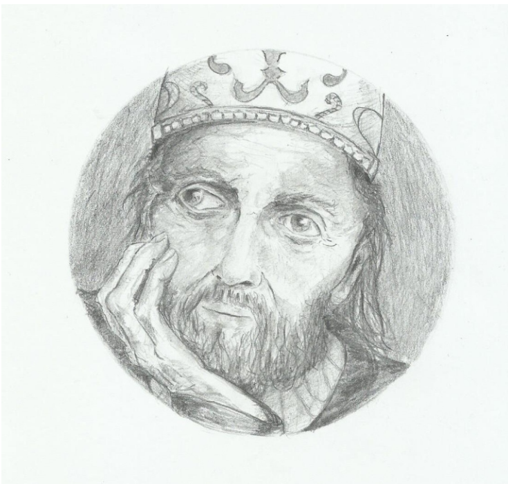
Ilustrace: P.V. Fojtík

Atribut, který si světec po staletí nese v ruce, ukazuje na způsob jeho umučení. Tímto atributem je vlastní hlava, s kterou dle legendy po svém stětí v Paříži na známém vršku Montmartre došel až na místo, kde nyní stojí bazilika Saint-Denis. Svatý Dionýsius je patronem střelců a vzývá se pro pomoc při bolestech hlavy, proti psímu kousnutí či vzteklině.