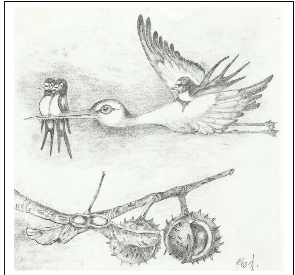
Ilustrace: J. Švajdová

Zpravodaj obcí Březnice - Bohuslavice - Salaš